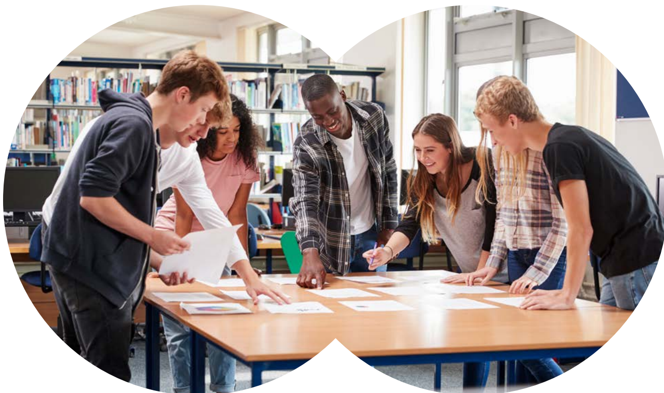
table des matières