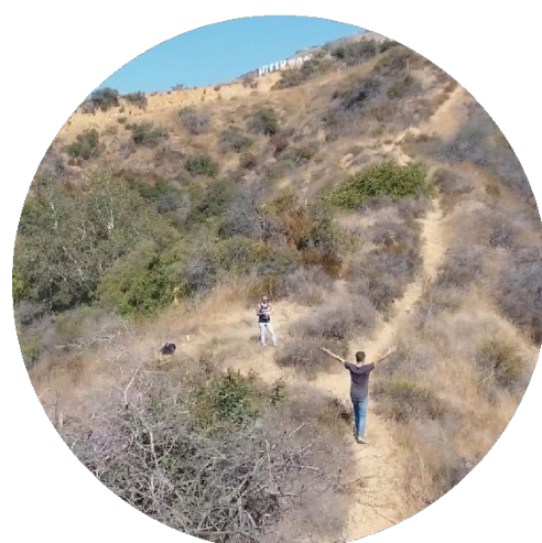
Kevin et Billy, bourse Sleep for Peace

Blog sur les destinations accessibles aux chiens en Nouvelle-Zélande